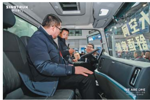
12月8日，中国重汽举办2025年合作伙伴大会及新品发布会，多款新车震撼亮相，吸引了众多参会合作伙伴驻足观看、试乘体验。