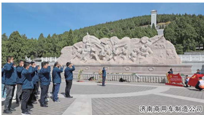
济南商用车制造公司