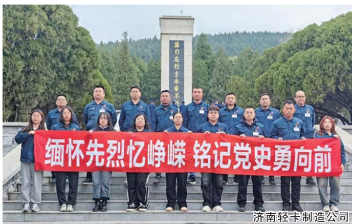
济南轻卡制造公司